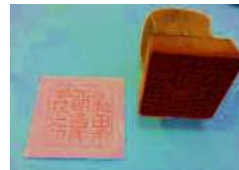
校長室に残る国民学校時代の学校印