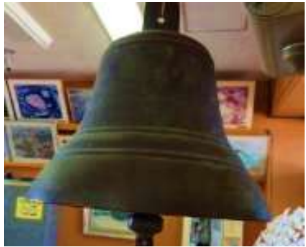
校長室に残る授業終始を告げていた鐘