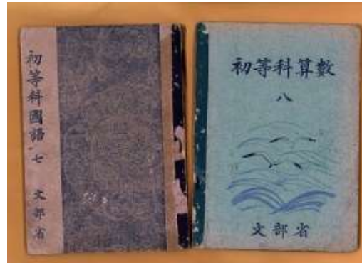
昭和 18 年度使用の国語と算数教科書