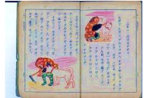
昭和 17 年度使用の 2 年生用読み方教科書