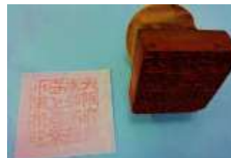
校長室に残る尋常小学校時代の学校印