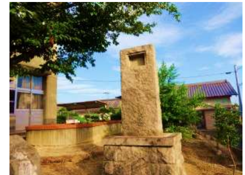
昭和 34 年に大正 3 年度卒業生から寄贈された鉄筋校舎竣工記念碑 凹部にはかつて時計がはめこまれていました。